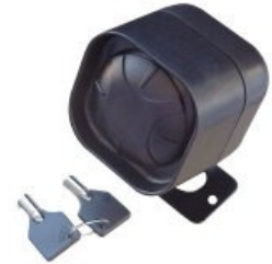
ミニバッテリーバックアップサイレン 80mm×60mm×50mm 鳴り出すと 配線を切断されても 鳴り止みません。P 355・RES4601・TPIに装着可能です。 [120DB]