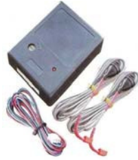
ウルトラソニックセンサー 車の周り 車内に入ってくる物体を感知します。