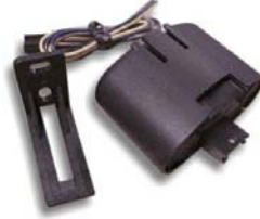
チルトセンサー 車両 の傾きを感知します。