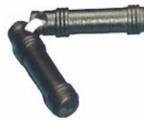
TPI 用スペア トランスポンダ