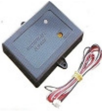
マイクロウェーブセンサー に近づく物体を感知します。