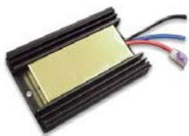
24V→12V 変換コンバーター