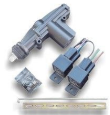
ドアロックアクチュエーター