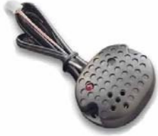
ガラス破損センサー ガラスの破 損音や金属音を検知します。