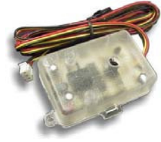
ショックセンサー 車体に加わる衝撃を感知します。