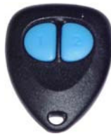
RES 用スペア リモコン