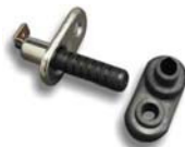
ドア開閉センサースイッチ