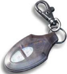
P385・P355・P275 用 スペアリモコン