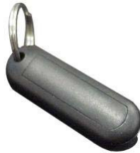
P205 用スペア トランスポンダ