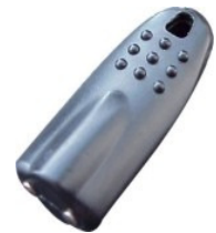
P165 用スペア タッチキー